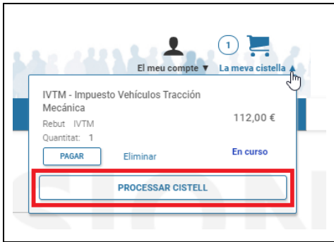
Figura 3. Cistella de la compra

A continuació, l'autoliquidació quedarà pendent de pagament i es podrà pagar seleccionant el botó de “processar cistella” que apareix en la icona del carret de la compra visible en la capçalera de la pàgina (veure Figura 3 ).