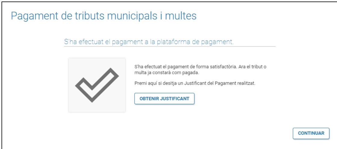
Figura 8. Extracte pagament

En finalitzar el pagament, des del TPV, es retornarà a l'aplicació de nou on s'informarà del resultat del pagament. A més es dona la possibilitat d'obtenir el justificant de pagament. (Veure figura 8 ).