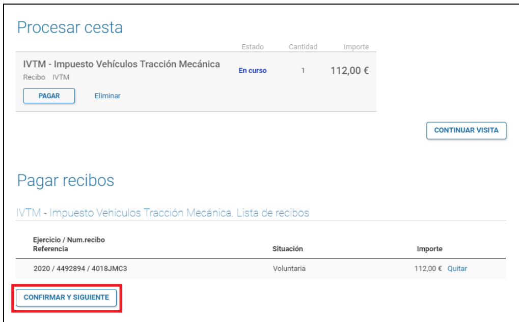
Figura 4. Processament de la cistella

En el següent pas, en la secció de “processar cistella” (veure Figura 4 ), es mostra el conjunt d'elements a pagar. En la secció de “Pagar rebuts” es mostra l'element que es pagarà. A continuació, seleccionem el botó de “Confirmar i següent”.