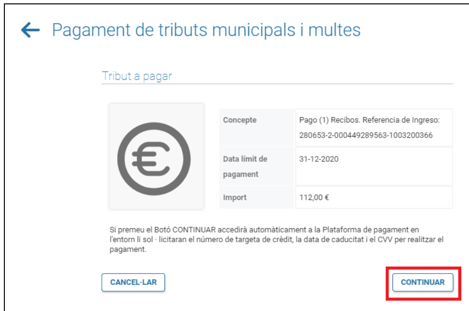
Figura 5. Resumen del pagament

Després de prémer el botó de “continuar” de la figura 5 , l'aplicació ens redirigeix a la pàgina del TPV on s'introduiran les dades bancàries (veure figures 6 i 7 ).